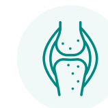
Douleurs musculaires et articulaires