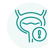
Règles irrégulières et plus abondantes