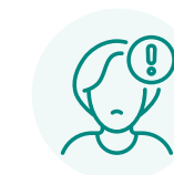
Pensées dépressives et sautes d'humeur